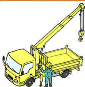
積載形トラッククレーン 過負荷防止装置

所定の建設機械に厚労省指定の安全装置を取り付けることで補助を受けられる制度です！